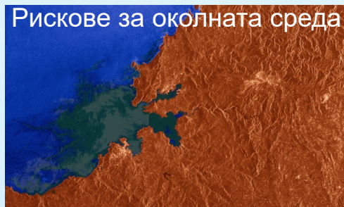
Рискове за околната среда