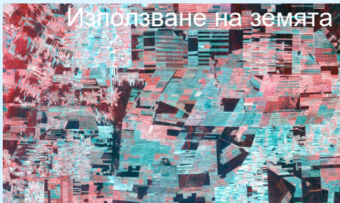
Използване на земята