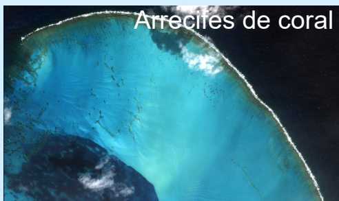
Arrecifes de coral