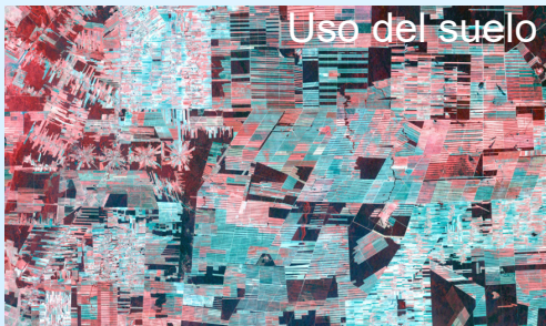
Uso del suelo