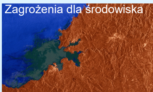
Zagrożenia dla środowiska